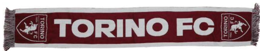
TR.SCJACQ01 SCIARPA JACQUARD SCRITTA BIANCA