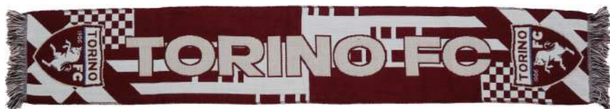
TR.SCJACQ03 SCIARPA JACQUARD SCRITTA BIANCA TORINO FC