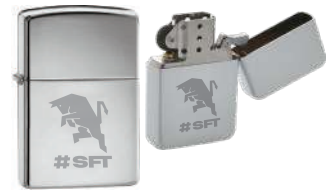
TR1321 ACCENDINO IN METALLO con logo inciso a laser