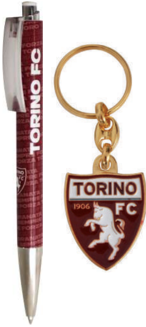
TR1438 SET PENNA+PORTACHIAVI