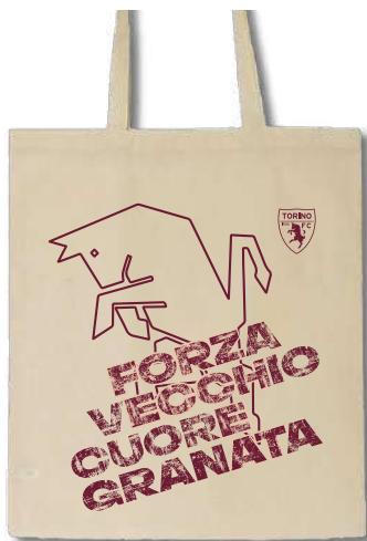
TR1391 SHOPPER IN COTONE ECRU'