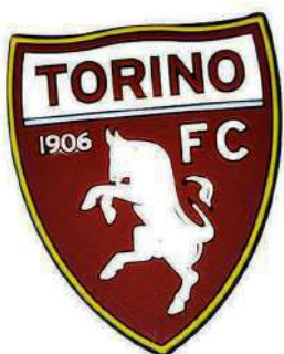
TR1630 MAGNETE IN GOMMA MORBIDA