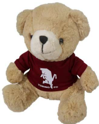
TR1330 ORSETTO GRANDE H. cm 24