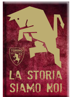
TR1621 MAGNETE STAMPATO