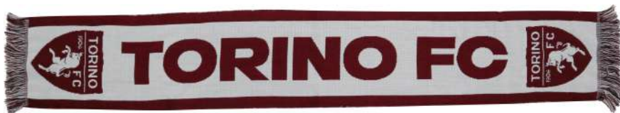
TR.SCJACQ02 SCIARPA JACQUARD SCRITTA BIANCA TORINO FC SU SFONDO GRANATA