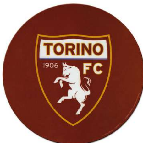
TR1409 MOUSEPAD TONDO ø cm 20