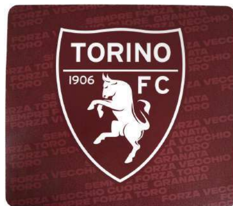
TR1408 MOUSEPAD RETTANGOLARE cm 20x23