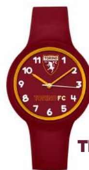
TR.PTR443KR1 OROLOGIO NEW ONE KID 34MM