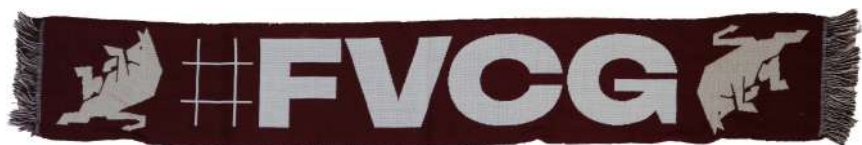
TR.SCJACQ05 SCIARPA JACQUARD SCRITTA BIANCA FVCG