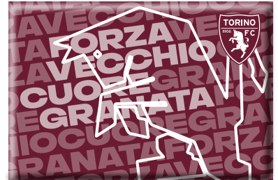
TR1623 MAGNETE STAMPATO