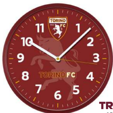
TR.00875TO1 OROLOGIO DA PARETE 30CM ABS