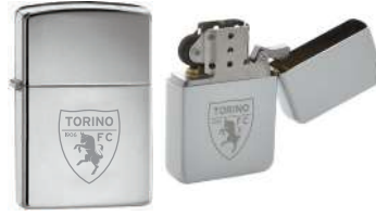
TR1323 ACCENDINO IN METALLO con logo inciso a laser