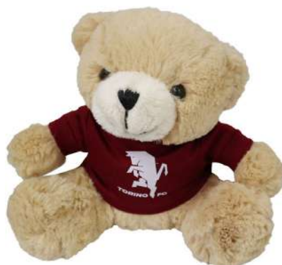
TR1331 ORSETTO PICCOLO H. cm 18