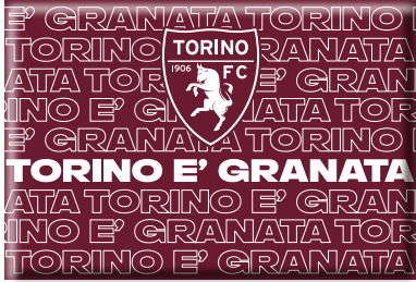
TR1631 MAGNETE STAMPATO