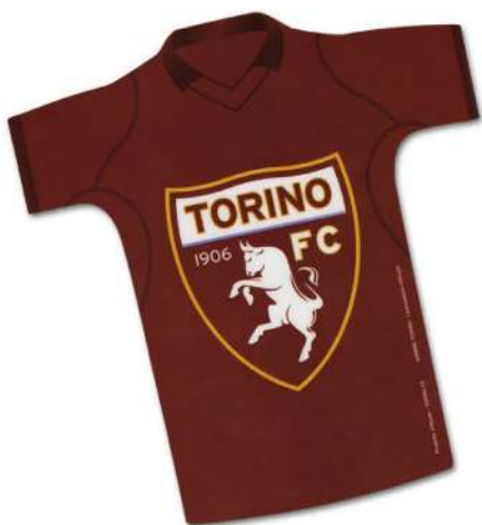
TR1410 MOUSEPAD SAGOMATO cm 22,5x21