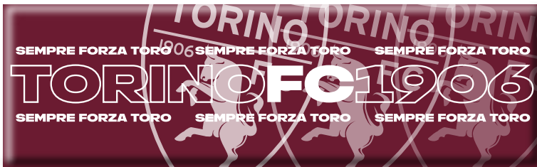
TR1639 MAGNETE STAMPATO - formato panoramico