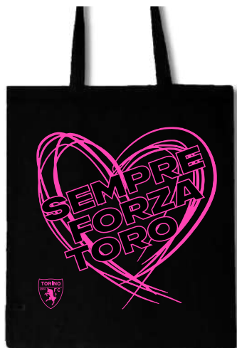
TR1390 SHOPPER IN COTONE NERA