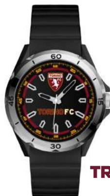
TR.PTN460XN1 OROLOGIO CHALLENGE UNISEX