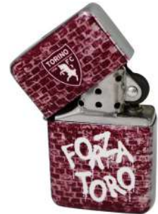
TR1365 ACCENDINO IN METALLO con grafica a tutta facciata