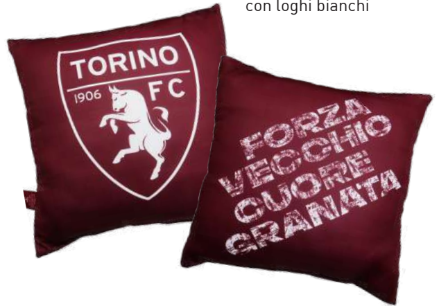
TR1241 CUSCINO SALOTTO BORDEAUX con loghi bianchi