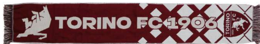
TR.SCJACQ07 SCIARPA JACQUARD SCRITTA BIANCA