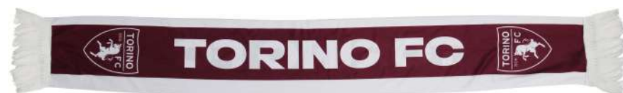
TR.SCPOLY01 SCIARPA POLIESTERE SCRITTA BIANCA