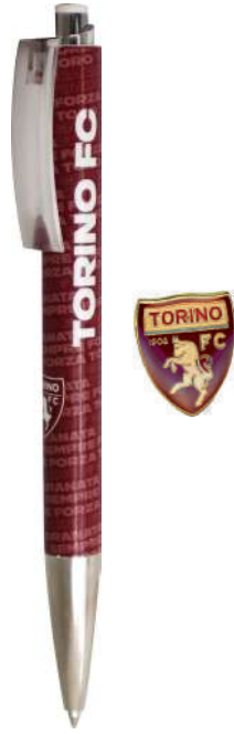
TR1439 SET PENNA+DISTINTIVO