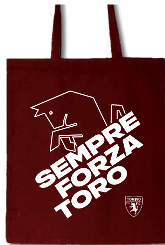
TR1392 SHOPPER IN COTONE BORDEAUX