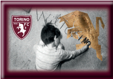
TR1624 MAGNETE STAMPATO