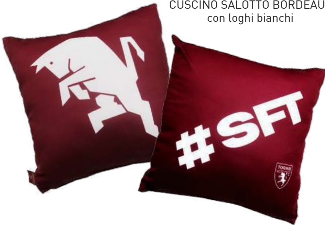
TR1240 CUSCINO SALOTTO BORDEAUX con loghi bianchi