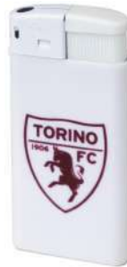
TR1362 ACCENDINO IN PLASTICA logo a 1 colore granata