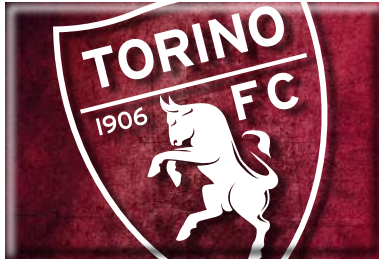
TR1632 MAGNETE STAMPATO