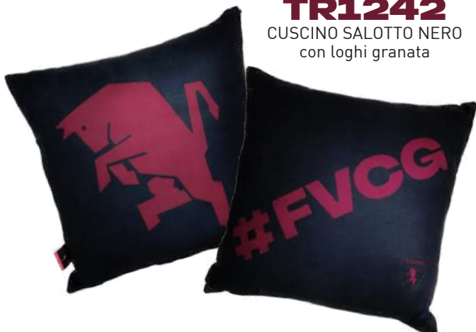
TR1242 CUSCINO SALOTTO NERO con loghi granata